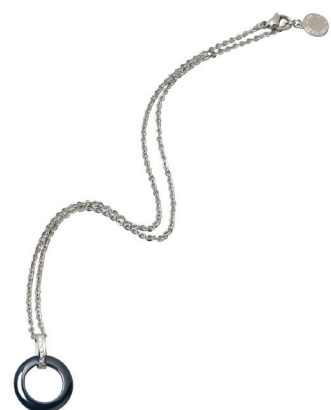
Boogie Blue 70-122