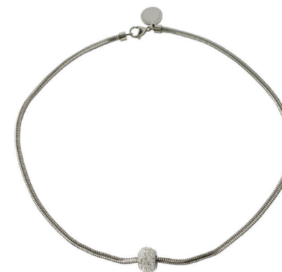
Lady White 70-965