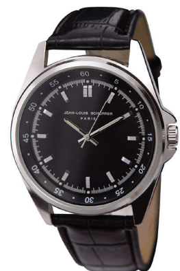
Contraste black 70-449