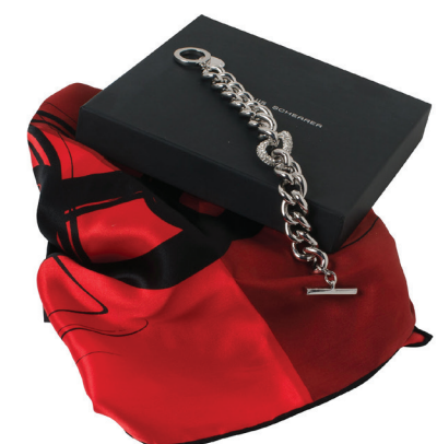
Set SPBF589 70-129