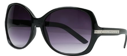
Lady Black 70-802