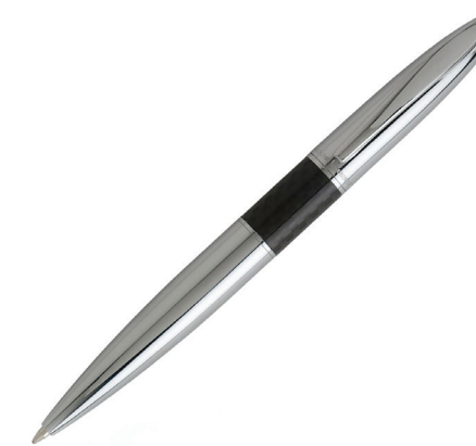
Catamaran Gomme Blue 71-344