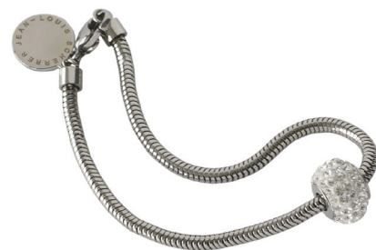
Lady White 70-964