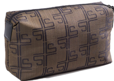
Tissue brow 70-428